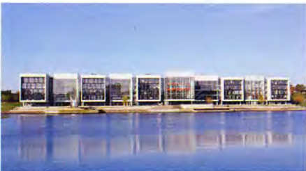
Ansicht vom „Alsion-Campus“